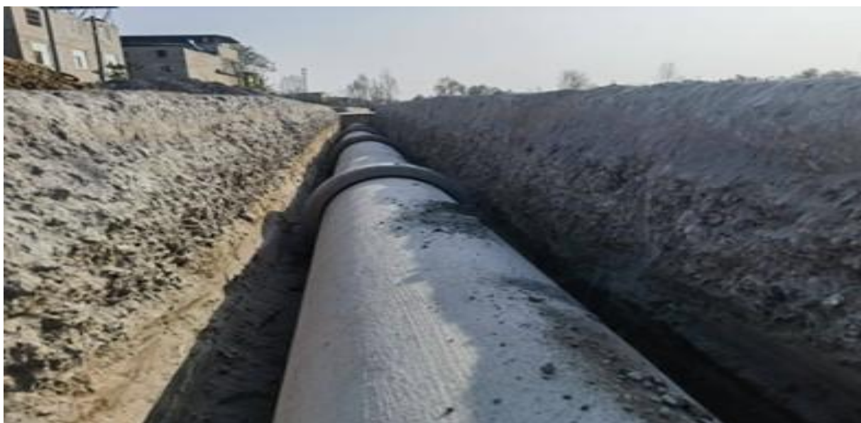
图：进出港大道 K2+580-K3+114 段收水井连接管安装现场

3. 第二路电源电力施工，9 基钢管塔基已施工完成，下一步进行立杆架设，由于与新路集团铺设沥青交叉作业，影响施工进度，正在协商解决。