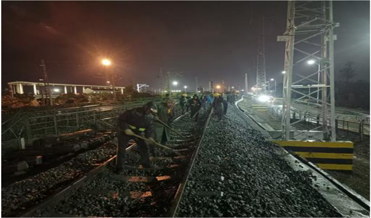
图：物流港铁路作业区轨道调整现场