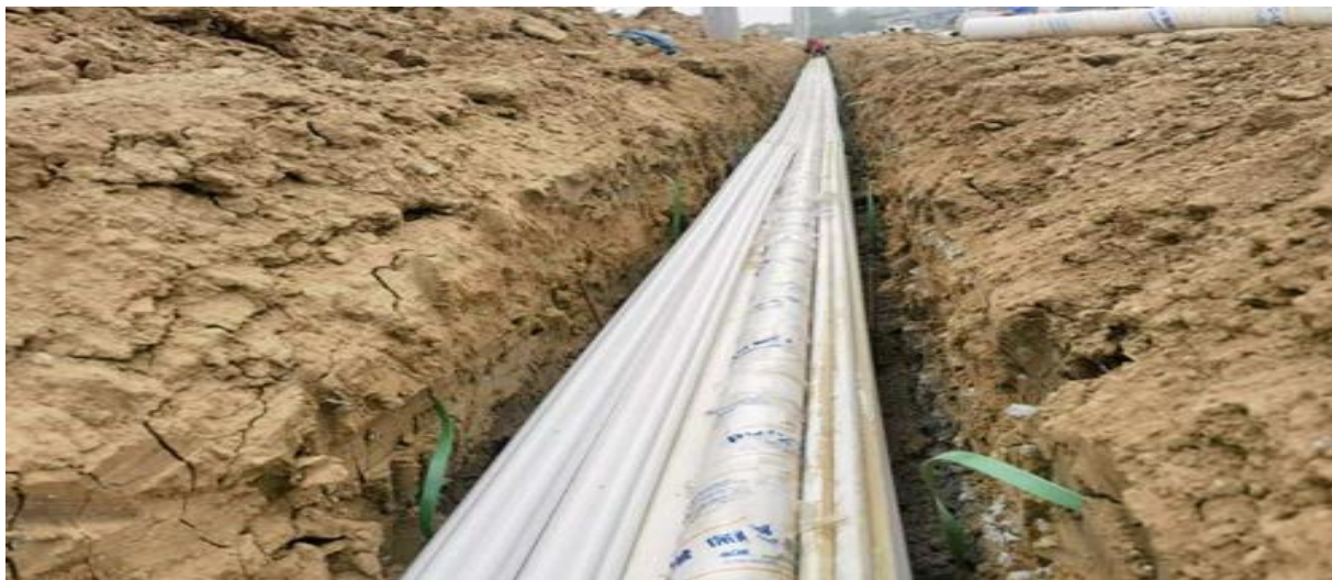
图：进出港大道 K1+300-K1+520 段弱电管道安装施工现场