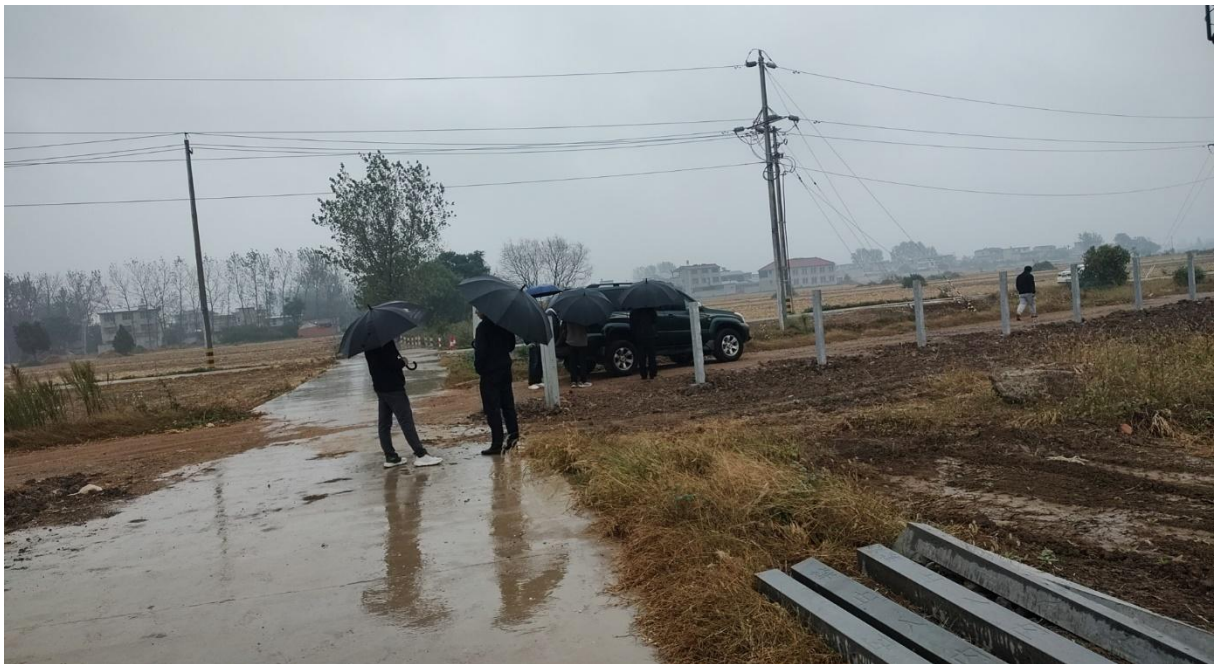
图：阜淮高铁小三改现场踏勘