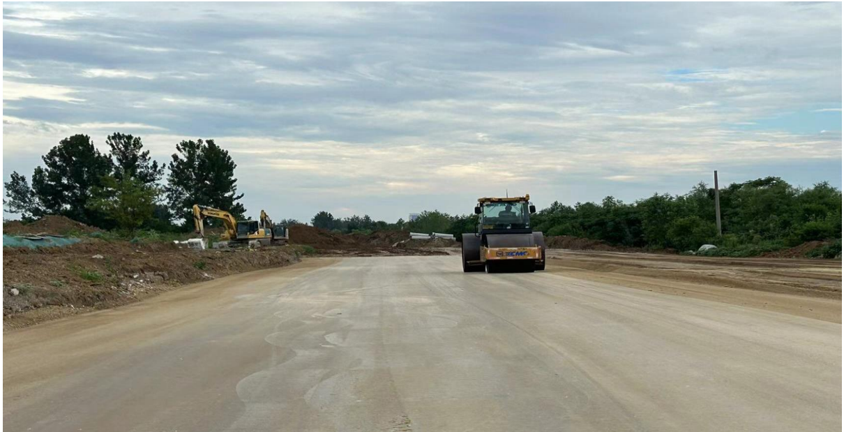
图：进出港大道 K1+300-K1+600 段左幅 6%灰土碾压施工现场