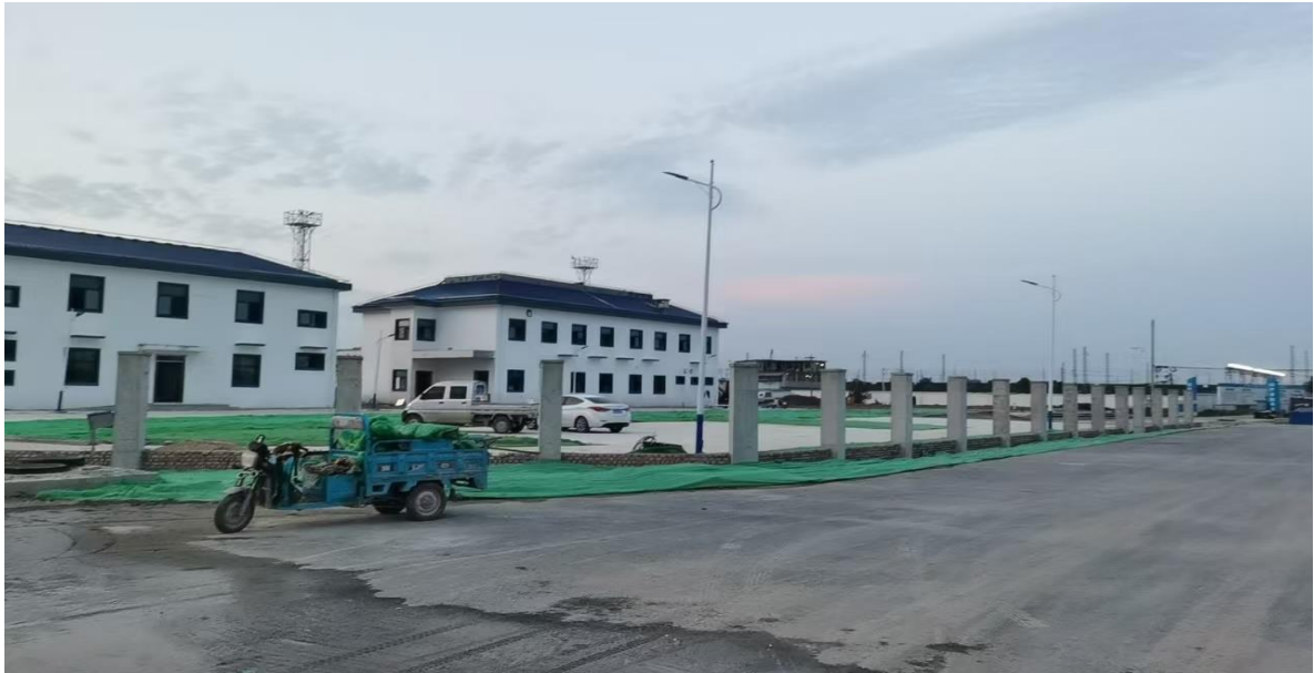
图：物流港铁路作业区施工现场

(1) K1+300-K1+600 段右幅 6%灰土第 3-4 层完成；K1+600-K1+750 段右幅 6%灰土第 2-3 层完成；(2) K1+300-K1+600 段左幅 6%灰土第 4 层完成；K1+600-K1+700 段左幅 6%灰土第 3-4 层完成 (3) K2+000-K2+230 段右幅 6%灰土第 1-2 层完成；(4) K2+148-K2+314 雨水工程管道安装、井室浇筑、6%沟槽灰土回填完成；(5) K2+447-K2+500 污水管道安装、井室浇筑、6%沟槽灰土回填完成；K2+500-K2+640 污水管道碎石回填、6%沟槽灰土回填完成；(6) K2+960 处沟塘级配碎石、6%灰土回填完成。